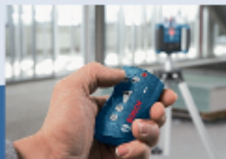
Remote Control Control remoto