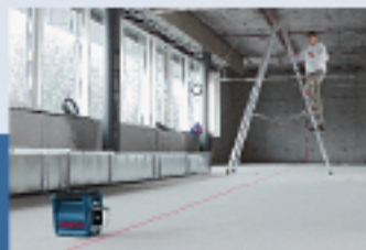
90-Degree Plumb and Layout Rayo de plomada y disposición a 90 grados